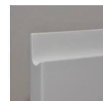
Front biały - uchwyt niewidoczny