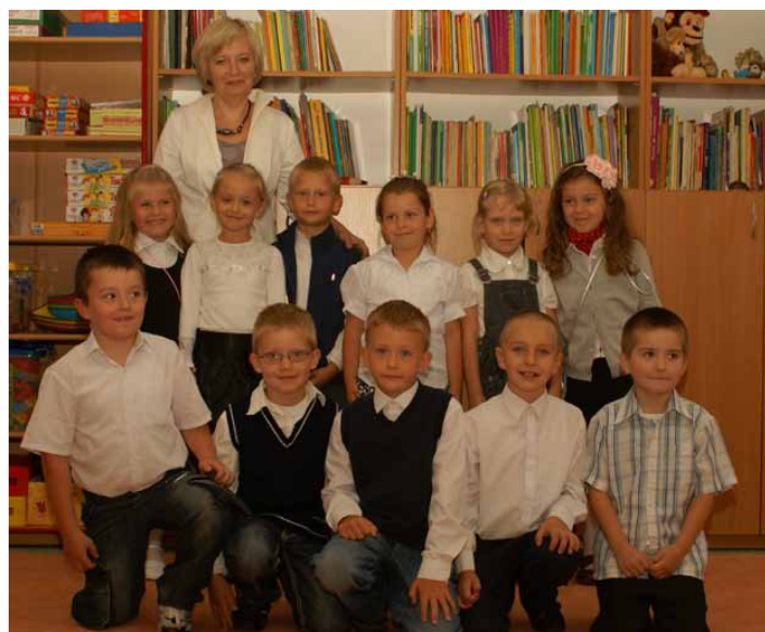
Klasa I, Szkoła Podstawowa w Laskowcu