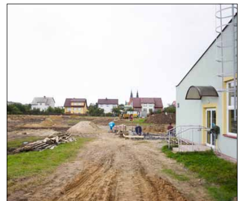
Trwa budowa Orlika 2012.