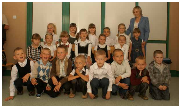
Klasa I A, Szkoła Podstawowa w Rzekuniu