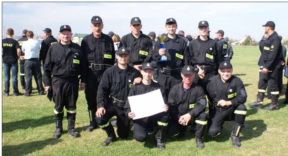
Drużyna OSP Dzbenin.

Na zakończenie imprezy można było obejrzeć mecz piłki nożnej, pod-