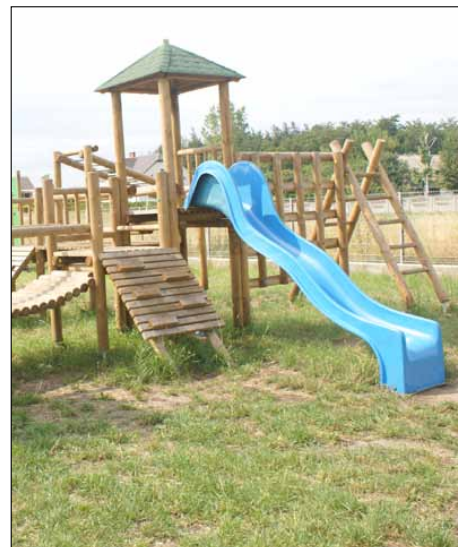
Plac zabaw w Dzbeninie.