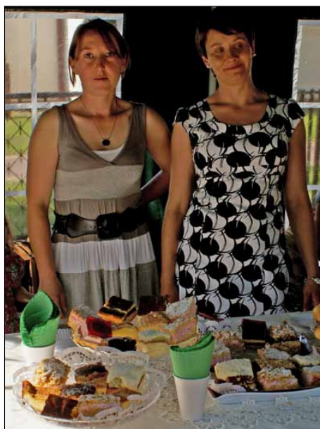
Podczas dożynek można było skosztować domowych przysmaków.