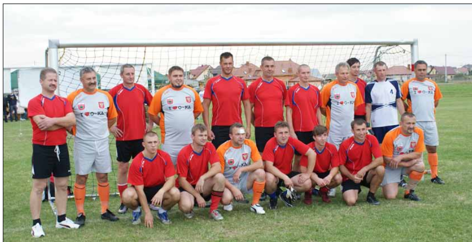
Samorządowcy Rzekunia i Ostrołęki przed meczem.