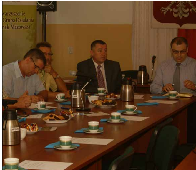
Spotkanie konsultacyjne LGD „Zaścianek Mazowsza” w Urzędzie Gminy w Rzekuniu, 12 sierpnia br.